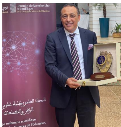
CAMIL® Model a reçu le trophée de l'innovation FSE – Université Mohamed V Rabat - 2023